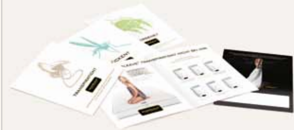
Prospekt mit Ladenanschrift für Ihre lokale Kampagne