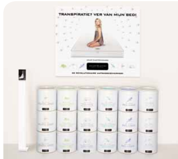
<< SmartSleeve®-Aufstellung im Verkaufspunkt

SmartSleeve® ist ein neues hochwertiges Qualitätsprodukt. Die Sichtbarkeit im Verkaufspunkt ist deswegen sehr wichtig, um die Aufmerksamkeit der Konsumenten zu wecken, denen eine gesunde Nachtruhe am Herzen liegt. Darum wurde eine differenzierende Verpackung mit dazugehörigen Prospekten und anderem Informationsmaterial entwickelt.