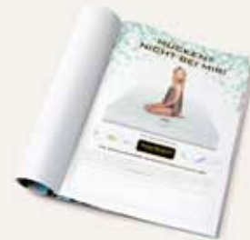
Anzeigen für Ihre lokale Kampagne